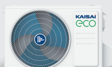
Jednostka zewnętrzna KEX