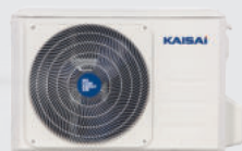
Jednostka zewnętrzna KSH